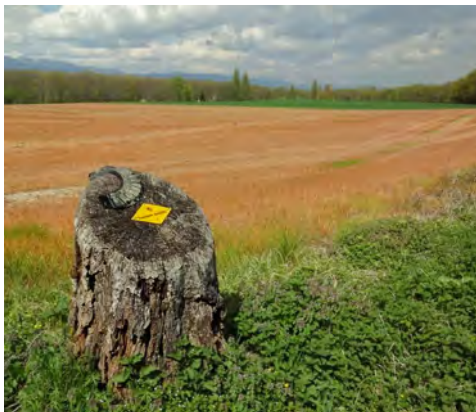
La campagne genevoise est sillonnée de chemins pédestres.