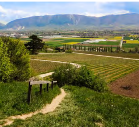
Vue sur le Salève depuis le Signal de Bernex.

www.geneveterroir.ch/fr/content/maison-du-terroir