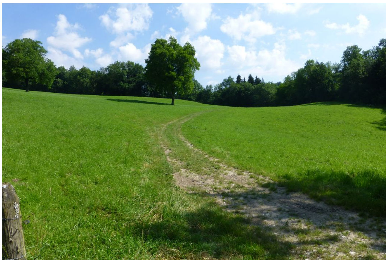
Belle prairie près des Usses

Nous trouvons à nous garer dans un carrefour de deux chemins. L'endroit est boisé et nous commençons la descente en direction de la rivière des Usses.