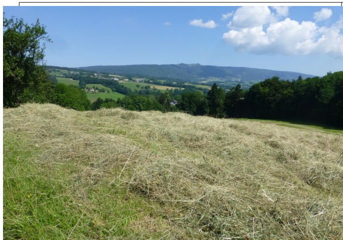
En pleine fenaison

Un peu plus loin notre chemin est barré par un gros arbre qui obstrue complètement le passage. Il faut escalader un peu pour passer de l'autre côté. Nous apprendrons qu'il est tombé lors du gros orage du 11 juin dernier. Juste après une meute de petit chiens plus bruyants que méchants signale notre arrivée. Nous sommes dans le ranch de Marly, une vieille maison bien retapée avec piscine et tous les équipements utiles aux chevaux. Les plaques collées sur le mur sont nombreuses et nous apprendrons bientôt de la tenancière que sa fille s'occupe de toute l'affaire et sert de coach à de nombreuses cavalières, venues d'Annecy pour la plupart.