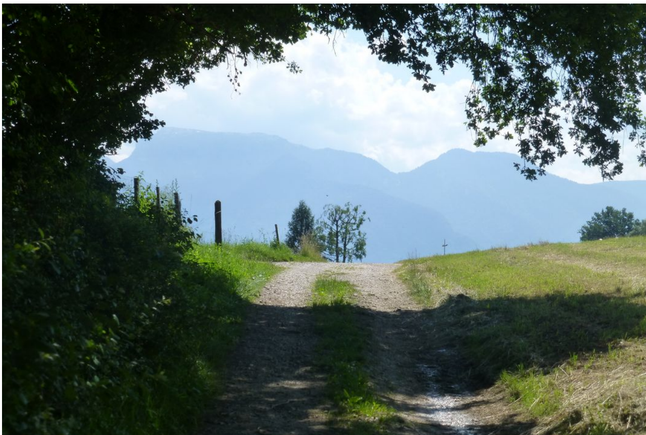
L'arrivée sur Groisy

Nous devons remonter encore un kilomètre ou deux par des voiries goudronnées avant de rejoindre un vrai et très joli chemin. Il passe en bonne partie dans la fraîcheur d'un bois ce qui n'est pas pour nous déplaire car le soleil tape fort,