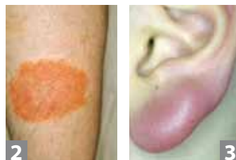
Erythème migrant sur la jambe (à gauche).