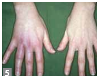
Irritation de la peau

d'une halte en «zone verte». Leurs endroits de prédilection sont les creux des genoux, parties génitales, nombril, creux des épaules et, chez les enfants, le cou et le cuir chevelu. Soyez particulièrement vigilants par rapport aux petites « nymphes » qui ne sont que d'une grosseur de 1 millimètre et que l'on retrouve le plus couramment sur l'être humain. Plus vite vous éloignerez une tique, plus le risque d'infection aux borrélioses diminue.