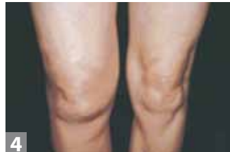
Enflure unilatérale des articulations