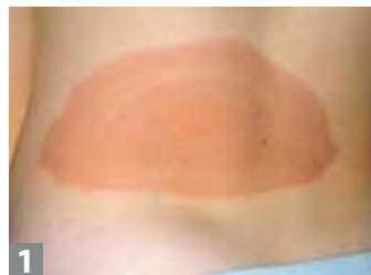
Erythème migrant sur le dos

Malgré une bonne protection, une tique peut se frayer son chemin à fin d'un bon repas sanguin! Inspectez-vous et vos enfants dès votre retour