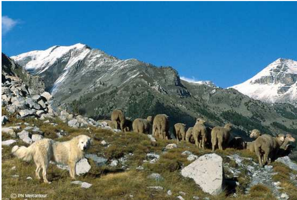
Chien de protection et troupeau domestique