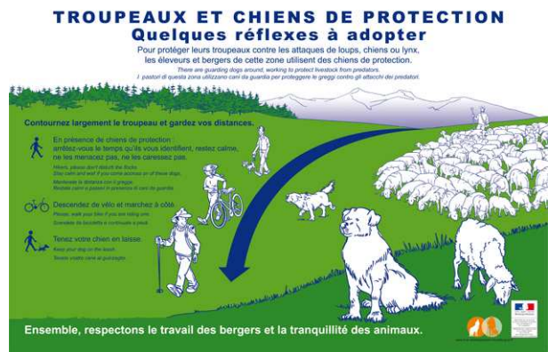
Nouveaux panneaux 2011