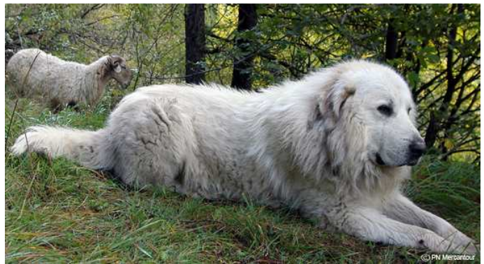
Chien de protection –patou