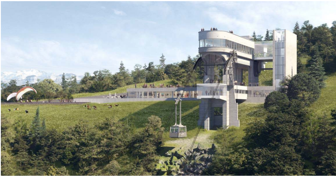
La gare supérieure du Téléphérique après rénovation