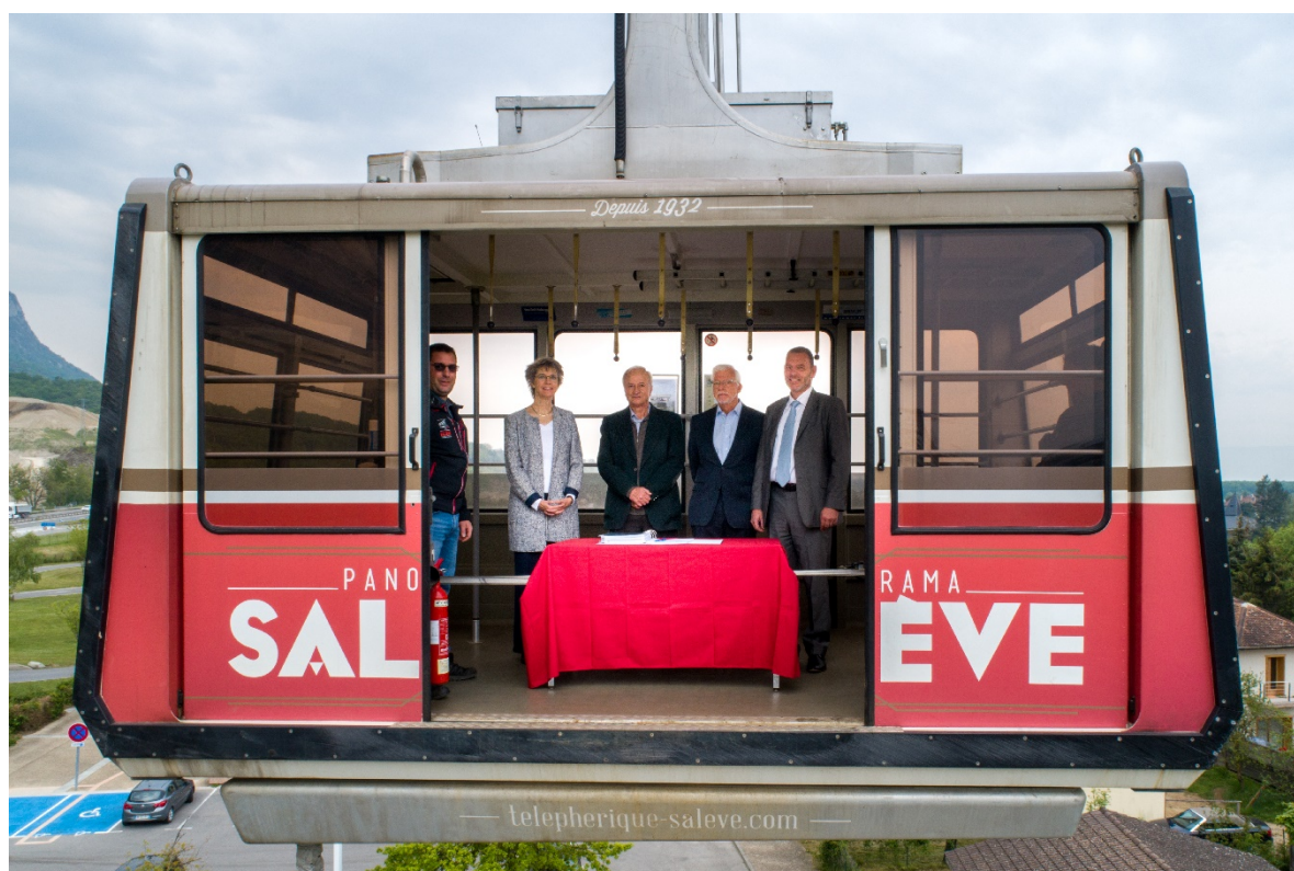
Signature de la DSP, en date du 17 mai 2019

A cette occasion, l'exploitant a présenté le programme de réhabilitation et d'animation de la gare supérieure concocté par ses soins pour une mise en œuvre dès la réouverture du Téléphérique à la fin du chantier des travaux de rénovation. Il a publié une brochure intitulée "Téléphérique du Salève, mon voyage nature, culture et loisirs - 2022 - Le nouveau Téléphérique du Salève".